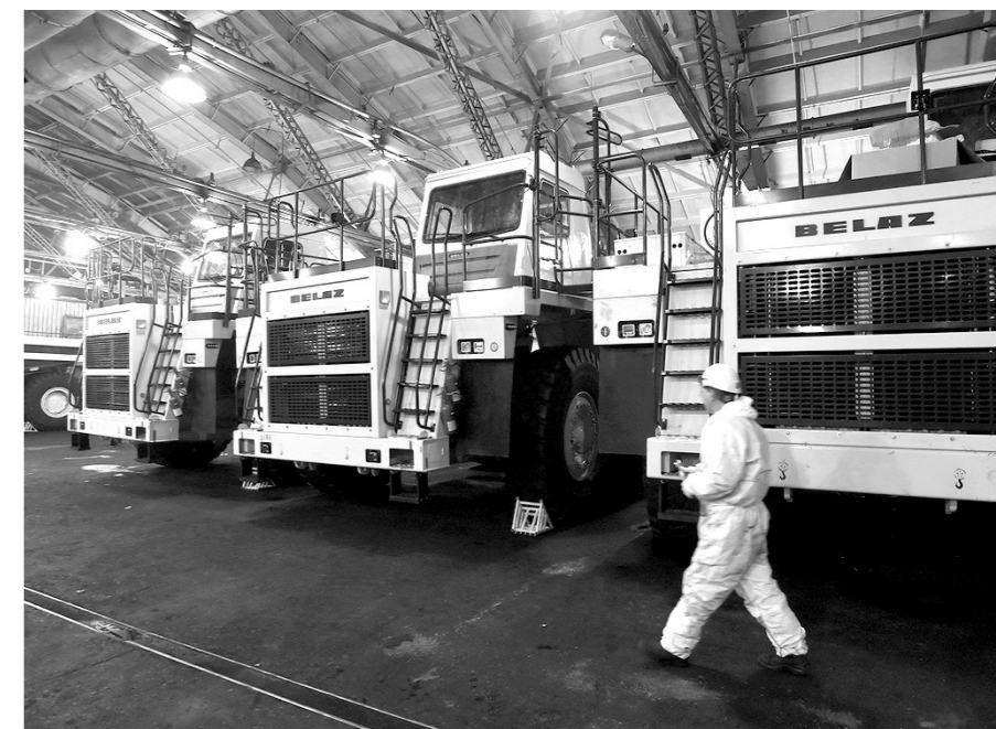
Новые БелАЗы будут трудиться на строительстве хвостохранилища ТОФ