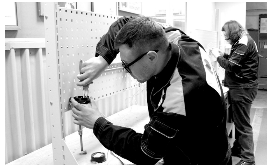
Все участники конкурса имеют разряд не ниже 5-го