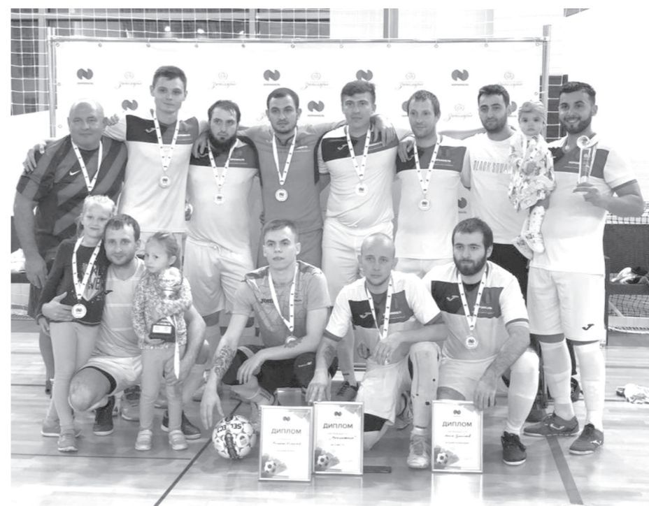
«Ремонтник» одержал победу благодаря тренировкам, мотивации, командному духу и правильно выбранной тактике

В финале корпоративных соревнований по мини-футболу в Сочи «Ремонтник» уверенно победил лидера соревнований — команду Кольской ГМК, с разгромным счётом 9:4.