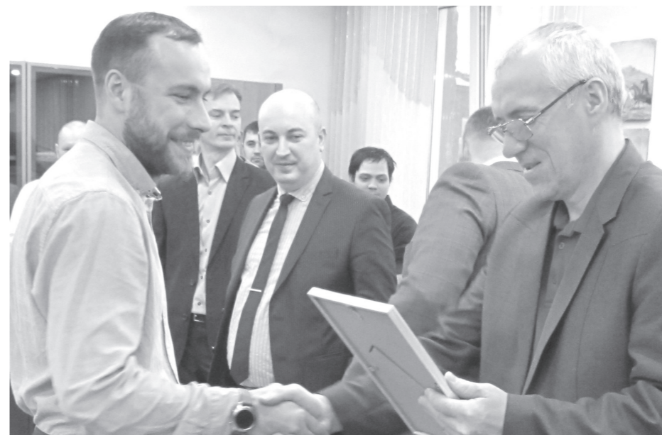
Церемония награждения ко Дню автомобилиста

В структурных подразделениях ООО «Норильскникельремонта» состоялась церемония награждения работников в честь празднования Дня автомобилиста.