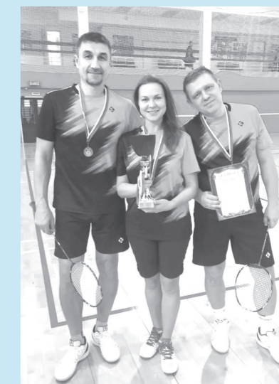
С 14 сентября по 12 октября прошли соревнования по бадминтону в зачёт 58-й спартакиады «Норникеля» (основная группа), где сборная команда «Ремонтник-1» (первая группа) заняла 1-е место, «Ремонтник-3» (вторая группа) — 2-е место.