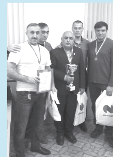
Соревнования по русским шашкам в зачёт 58-й спартакиады «Норникеля» состоялись с 14 сентября по 13 октября. Сборная команда «Ремонтник-1» (первая группа) заняла 1-е место, «Ремонтник-3» (вторая группа) — 2-е место. Поздравляем победителей и призёров! Желаем дальнейших успехов и новых побед!